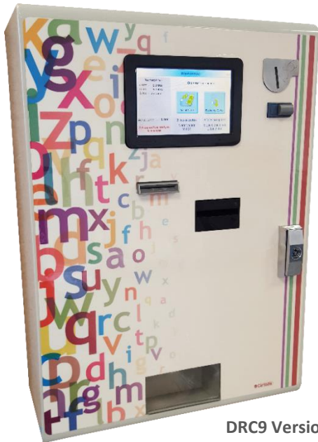
DRC9 Version Murale

Distributeur / Chargeur autonome de cartes magnétiques pour le paiement des copies et impressions